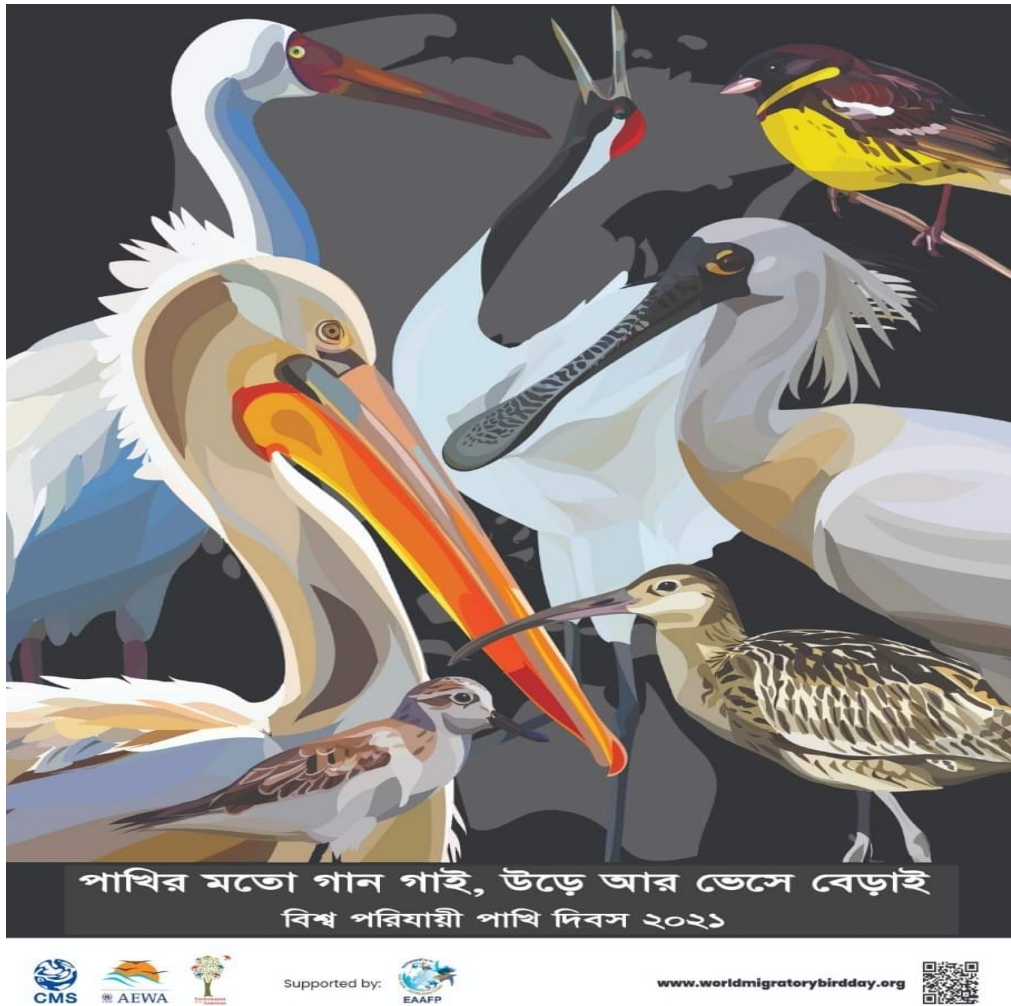
Leaflet with WMBD and EAAFP logo