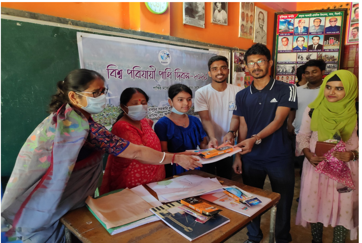
Prize Giving Ceremony