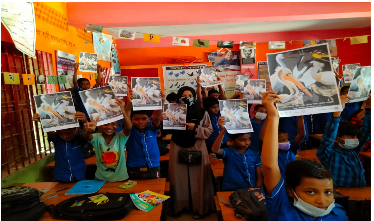
Distribution of Posters and leaflets