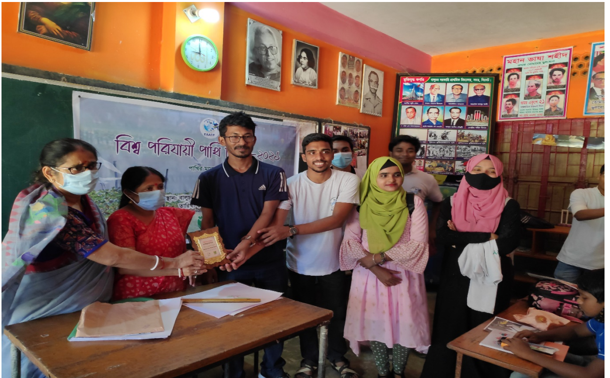
Crest Giving Ceremony