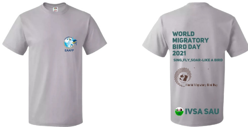
T-Shirt Design (Front and Back)