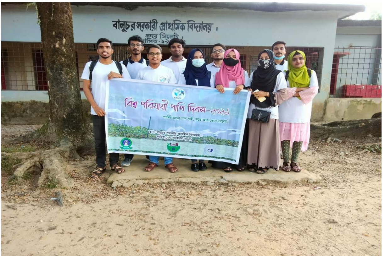
Volunteers with WMBD and EAAFP printed T shirt